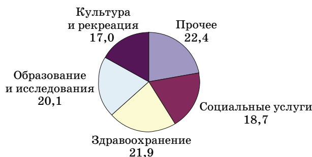
Рис. 2. Структура вклада в добавленную стоимость НКС по отраслям в развитых странах, %

Что касается структуры добавленной стоимости оказываемых услуг в НКС, то наибольший удельный вес в ней, по данным института Дж. Хопкинса, занимают три отрасли: культура и рекреация, образование и исследования, здравоохранение и социальные услуги (рис. 2).